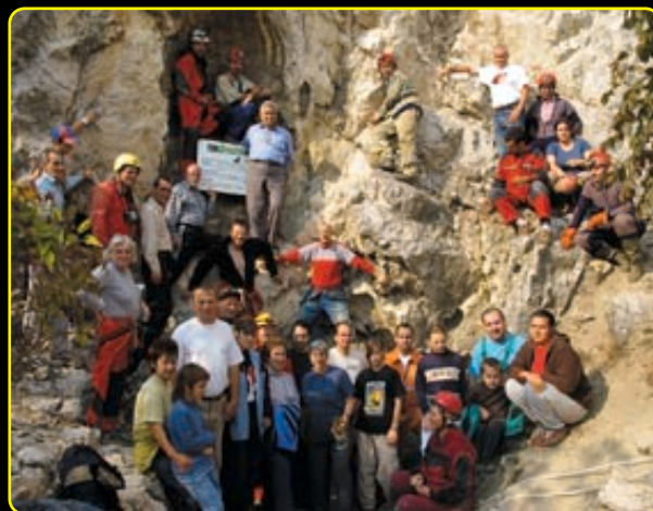
Barlangászok a bejárat előtt

Készült a BEBTE gondozásában. Szöveg: Lieber Tamás, Sásdi László Fotók: Barna József, ifj. Barna József, Fagyas F. Gábor, Lieber Tamás, Sásdi László Kiadja a Benedek Endre Barlangkutató és Természetvédelmi Egyesület Cím: 2510 Dorog, Schmidt Sándor ltp. 36. 3/15., telefon: 06-20/520-1261, e-mail: bebte@index.hu , internet: www.bebte.hu