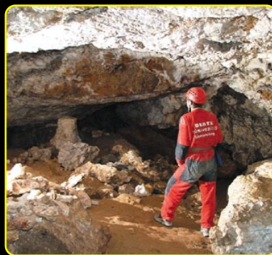
Részlet a Benedek Endre-teremből

Benedek Endre csoportjának egyik legfigyelemreméltóbb eredménye a barlang „Kadic' szakaszának” megtalálása volt 1976-ban. A barlangrész bejárata a 80-as évek elején beomlott, azóta nem látogatható. A Kadic' Csoport 1988-as megszűnését követően új szerveződéssé bontakozott ki. A lelkes fiatalokból verbuválódott csapat a Benedek Endre által megkezdett irányvonalat követve vált a dorog-esztergomi barlangkutatás és természetvédelem napjainkban legmeghatározóbb szervezetévé. A Közhasznú Szervezet a Benedek Endre Barlangkutató és Természetvédelmi Egyesület (BEBTE) nevet viseli.