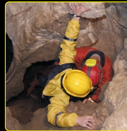
Turista a barlang középszintjén

Az egyesület természetvédelmi munkáját Esztergom Város Képviselő-testülete 2006-ban a „Dr. Jócsik Lajos-díjjal” ismerte el.