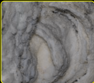
Gipszbevonat a barlang alsó szakaszán

A geológusok ma már úgy vélik, hogy sokkal kisebb a hévíz szerepe a barlang kialakításában, mint azt korábban gondolták, az utóvilkani hatások pedig jóformán teljességgel elvethetők. A süllyedő-emelkedő karsztvíz mellett ugyanakkor a párakondenzációs hatásokat is jelentősnek vélik (első sorban a gömbfülkék kialakulásánál). A gipszképződésményekben ( \text{CaSO}_4 \times 2\text{H}_2\text{O} ) jelenlévő kéntartalmat a kőzet repedéseiben és a triász mészkő feletti eocén fedőüledékében előforduló pirít bomlásával magyarázhatjuk. A barlangban ugyanakkor különféle, barit ( \text{BaSO}_4 )-, kalcit ( \text{CaCO}_3 )-, valamint aragonitképződésmények ( \text{CaCO}_3 ) is megtalálhatóak. Az oldásformák közül a legtetszetősebbek a fentebb már említett szabályos „kőbuborékok”, a gömbfülkék.