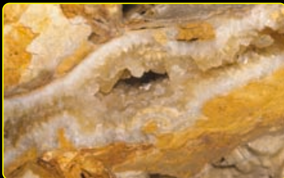
Kalcittal kitöltött vető