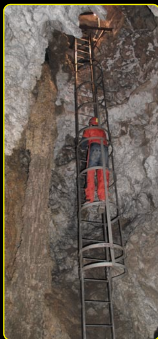
Ereszkedés a Benedek-terembe

A kristálybarlang 1946-os „hivatalos” felfedezésének híre nemcsak a szakembereket vonzotta a „mesés kincsekhez”, hanem a környékeliek is szép számmal keresték fel az üreget. A gyűjtők - akik között a „hivatalból” eljáró muzeológusok ugyanúgy előfordultak, mint laikusok - ritkán távoztak üres zsebbel. Amit nem a gyűjtők hordtak el, azokban vandál kezek okoztak felbecsülhetetlen károkat. Az üregrendszer sorsa 1958-ban kedvezőbbre fordult, mert a feltárási munkálatok, a gondozás illetve a felügyelet szervezett formát öltött. Ebben elvitathatatlan érdemeket szerzett Benedek Endre bányafőmérnök (1912-1987), aki ekkor alapította meg az első dorogi, ún. Kadic' Ottokár Barlangkutató Csoportot. A társaság nemcsak ebben a barlangban, hanem a szomszédos, 2006-ban ismételten megnyitott Strázsa-barlangban és a Pilisnyergi-víznyelőben is jelentős feltáró-kutató munkát végzett.